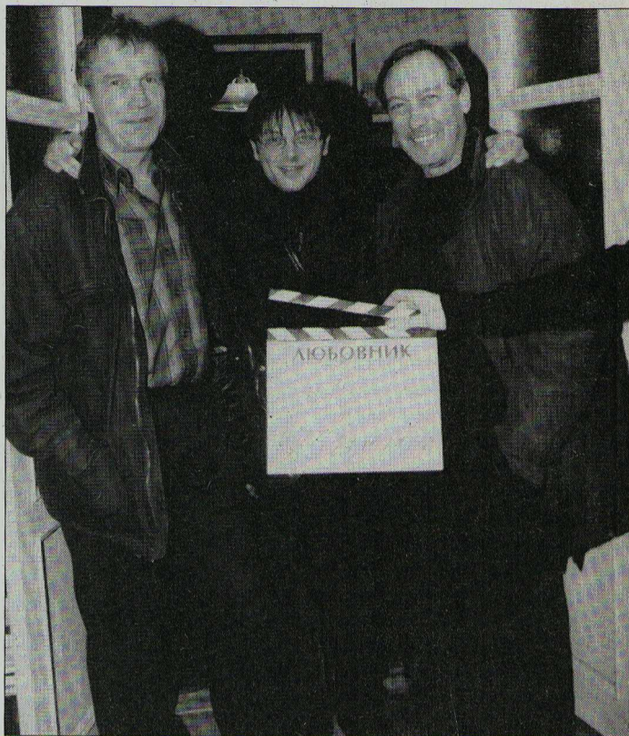
Валерий Тодоровский в кругу своих главных актеров.

– Оба ваших самых громких хита – и «Любовь», и