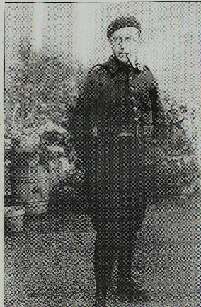
Сартр через полтора месяца после начала войны. «Я фотографируюсь, чтобы посмешишь друзей», — говорил он своим сослуживцам.

Для искушенного читателя это будет основной интригой — следить, как из аморфных, сюжетно запутанных, чрезмерно подробных «Дневников странной войны» постепенно вырастает центральная интуиция «Бытия и Ничто». Поначалу Сартр мучительно размышляет над своим вынужденным нахождением на войне, войне, которую он не выбирал (считал себя пацифистом) и целей которой он не понимает. Это двусмысленное положение на дву-