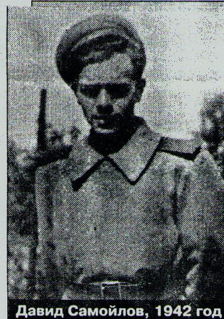
Давид Самойлов, 1942 год