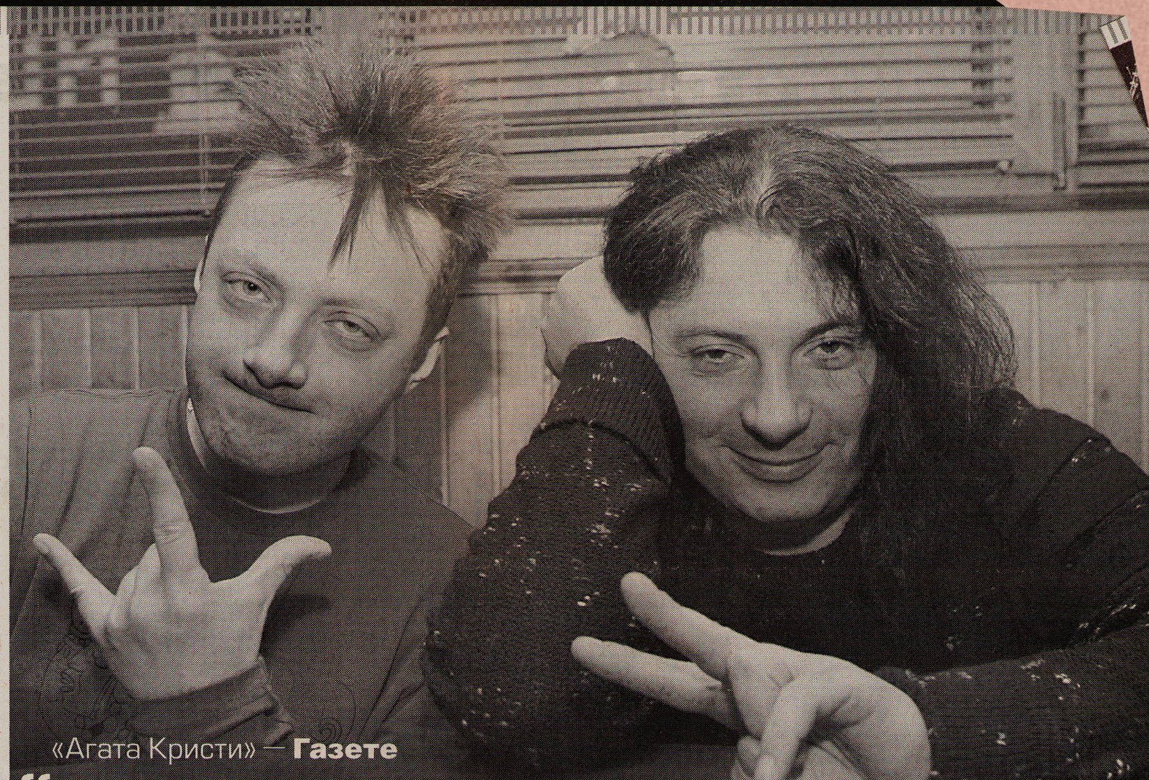
«Агата Кристи» — Газете

ВС: Мы сейчас находимся в ситуации, похожей на ту, что была в конце 1980-х — начале 1990-х. Тогда сначала везде был рок-н-ролл, а потом он был заглушен массой электропопа, «ласковых маев», «миражей». Сейчас мы в той же ситуации, только еще более сложной. В связи с развитием капитализма, общества потребления в шоу-бизнесе — полная прямая за-