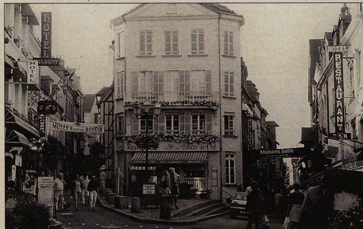
Онфлер – последний город Франсуазы.

Рассказывают, что получив свой первый гонорар, расте-