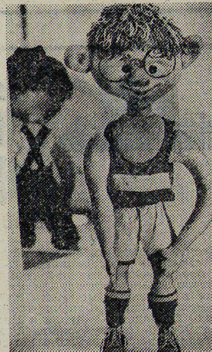
Фото А. ФИЛАТОВА. Ташкент.