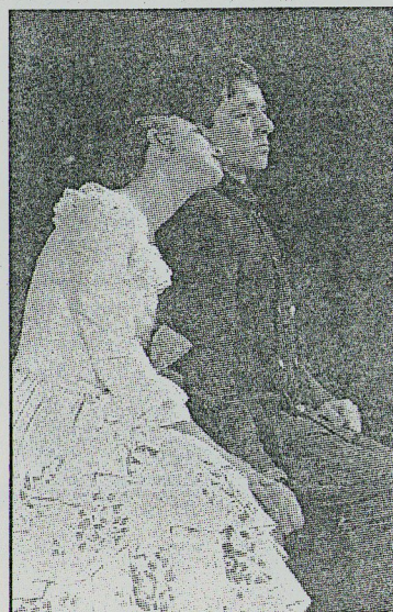
«Правда – хорошо, а счастье лучше»