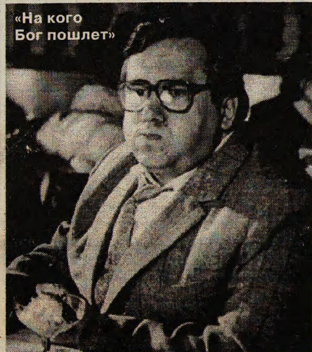
«На кого Бог пошлет»