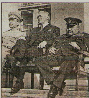
■ Фильм «Тегеран-43» посмотрели 50 млн зрителей

Ингушетии. Они обратили внимание, как инженер похож на Сталина, и попросили его телефон.