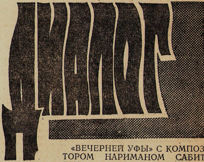
«ВЕЧЕРНЕЙ УФЫ» С КОМПОЗИТОРОМ НАРИМАНОМ САБИТОВЫМ.