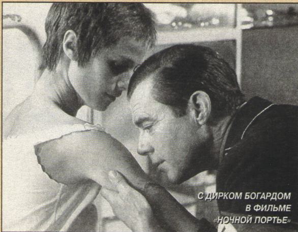
С ДИРКОМ БОГАРДОМ В ФИЛЬМЕ «НОЧНОЙ ПОРТЬЕ»

— Что-то вроде того... Впрочем, тогда я просто мстила своему отцу. Карьерный офицер британской армии, он воспитывал меня в страшной строгости. И когда я захотела стать певицей в кабаре — у меня уже был заключен