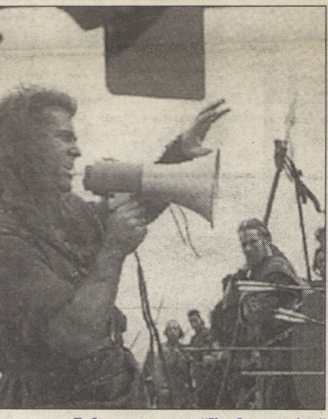
Гибсон на съемках "Храброго сердца"

на персонажа романа, поэтому мы подогнали параметры роли под актера. То же самое было с исполнительницей женской роли. Поначалу я был в отчаянии, потому что все девушки, которые мне нравились, оказывались либо героинями рекламных роликов о достоинствах сплетки, либо порнозвездами. Либо, по словам Массимо, принадлежали не к тем политическим партиям. (Смех). Порой мне казалось, что я тону в ноевских и тонкостях культурных различий и акцентов. Покажите мне в Риме англичанку, заказывающую кофе, и по одной ее фразе я определю, кто она, откуда приехала, кто ее друг, где она покупает нижнее белье... Впрочем, я опять отвлекаюсь. (Смех). Когда появилась Мария Грация Кучинотта, мы с Массимо долго спорили относительно ее кандидатуры. Я говорил, что она не умеет играть, а Массимо уверял,