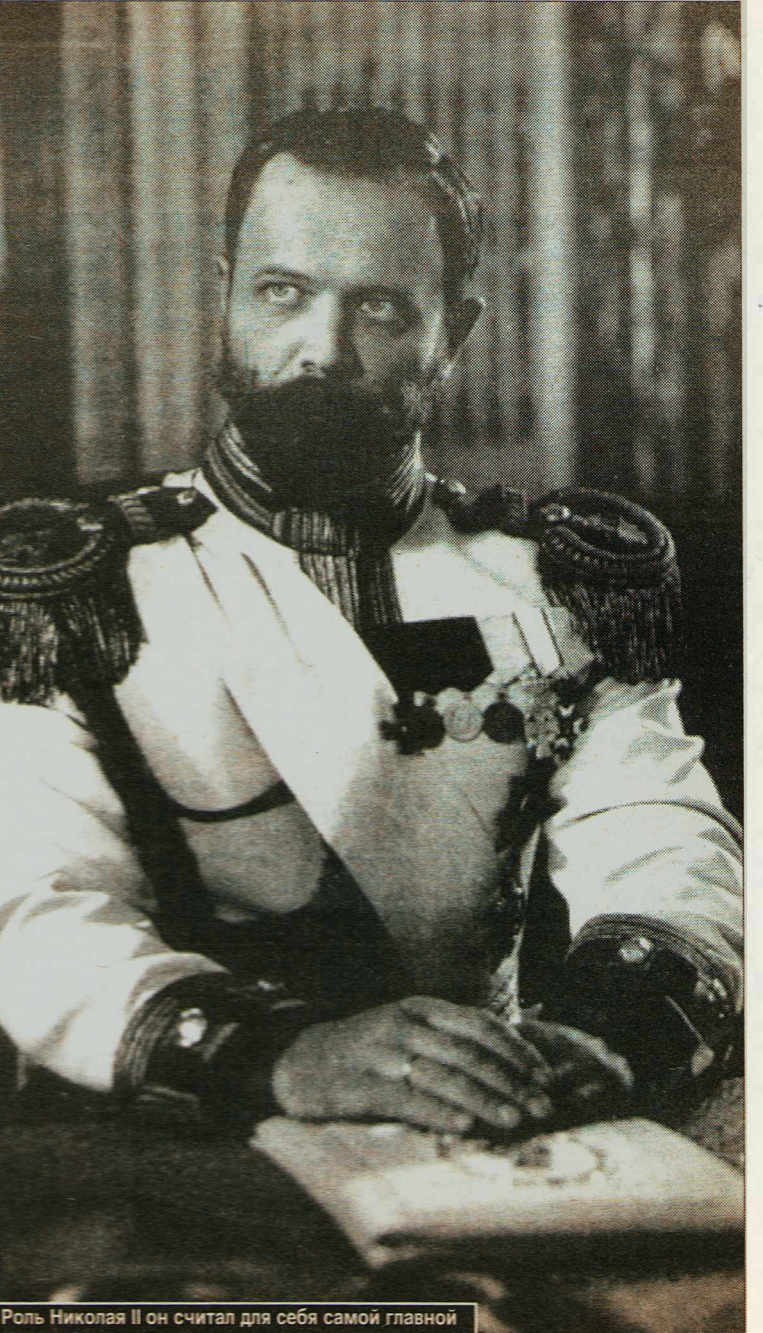
Роль Николая II он считал для себя самой главной