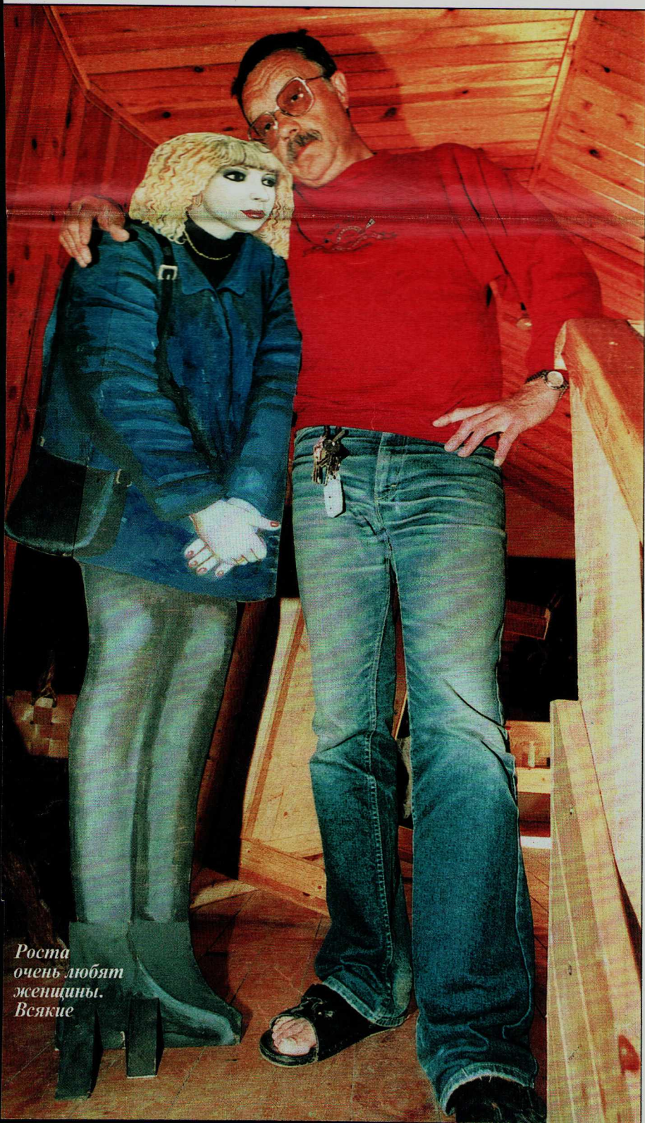
Ростя очень любят женщины. Всякие