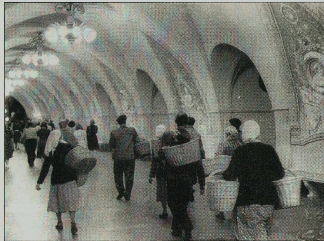
Колхозники в метро

Вернувшись домой, я нашел неизданный у нас альбом старых фотографий Картье-Брессона о Москве 1954 года и решил поделиться радостью с вами на правах знакомого.