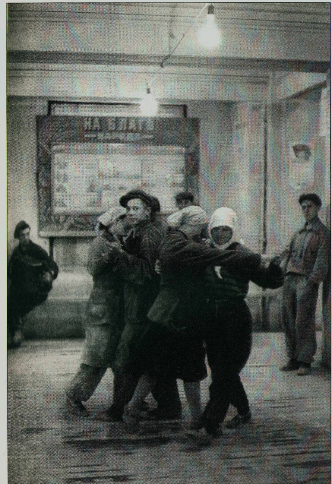
Танцы в обеденный перерыв