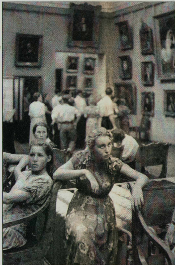
В Третьяковской галерее

... А на этой фотографии Ю. Роста, снятой в декабре 2000 года, Иоселиани в гостях у Картье-Брессона