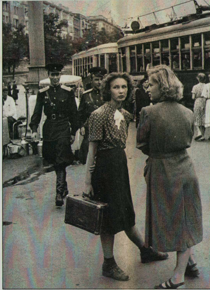
На трамвайной остановке. Пл. Ногина