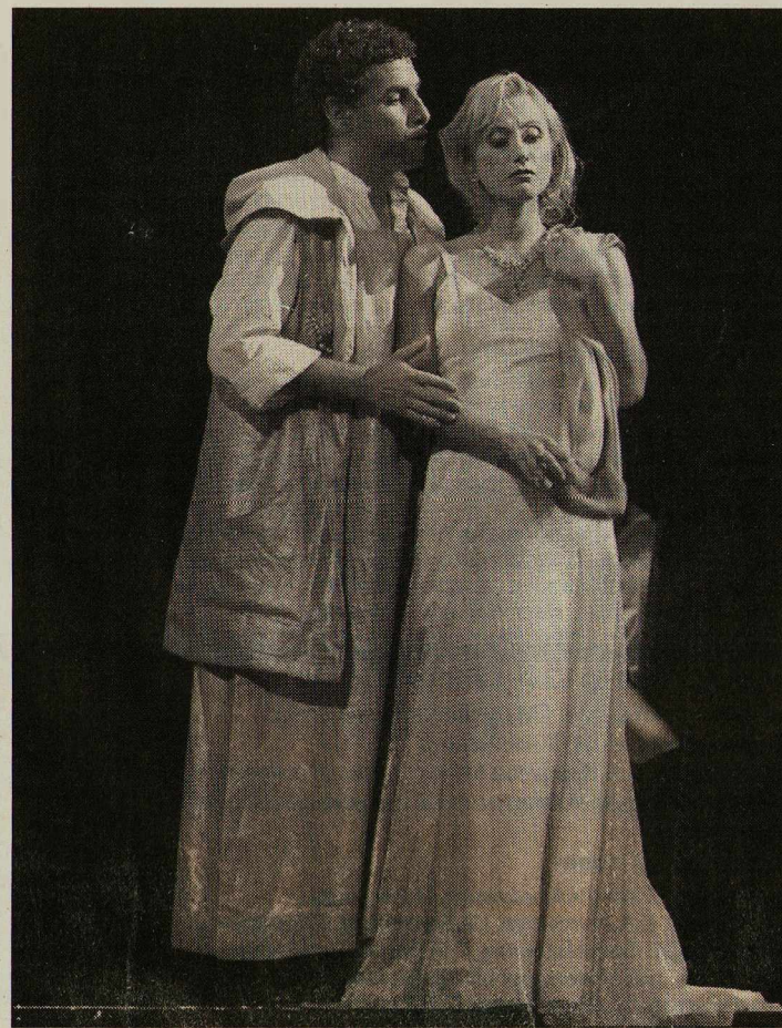
Сцены из спектаклей “Семирамида” (слева) и “Граф Ори”