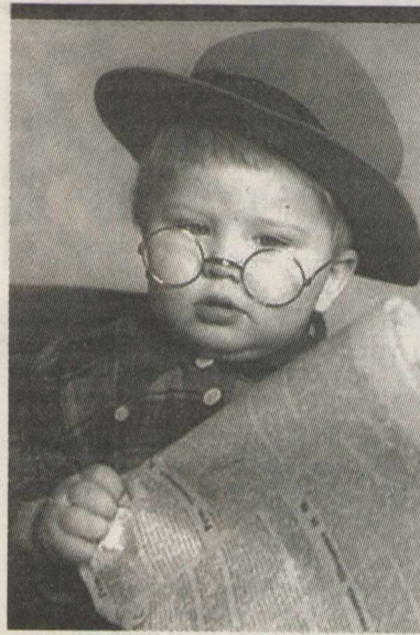
В ожидании рок-н-ролла

— Продолжим тему сопоставлений. «Кто виноват?» Романова и «Поворот» Макаревича — две программные темы нашего рока. Их наизусть знает и поет вся страна. Они возглавляли хит-парады с начала 80-х. Но в них словно отражены два разных взгляда на мир с одной и той же стороны?