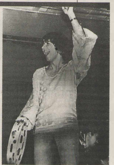
Времена «Кузнецкого моста»