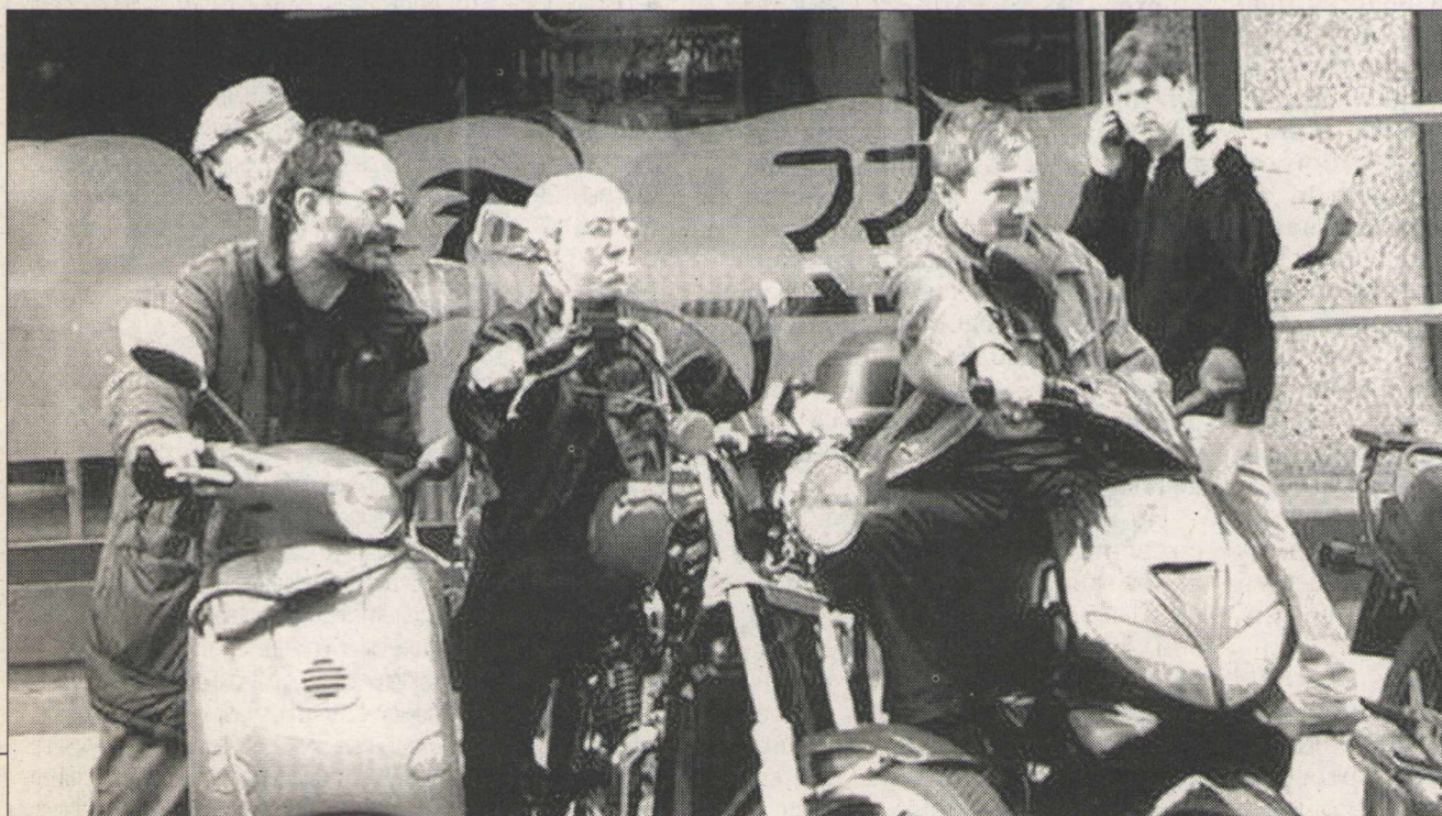
Мотоцикл – рабочий инструмент музыканта

Элтон Джон тоже знает, что он смешной. Тем не менее у этого «клоуна» много вполне классной, высокой лирики, и она воспринимается без всякой ухмылки. А Гарик Сукачев – смешной, нет? Иногда страшно... Меня несколько лет назад как-то пригласили на его концерт – выступить. Гарик на белом коне, с камерным оркестром, со своими дудками, с гостями. К моему выходу они уже часа два колбасили. И Гарик – такой боксер-профессионал, дыхание у него абсолютно бесконечное. Глаза навывкате. Я у Сережки Галанина спрашиваю: «Как он это выдерживает?» Сережка говорит: «Не знаю, я уже еле на ногах стою, а он, по-моему, еще не разошелся даже». Во боец!