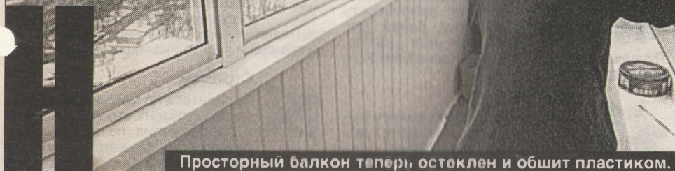
Просторный балкон теперь остеклен и обшит пластиком.

Больше всего времени музыкант проводит на кухне.