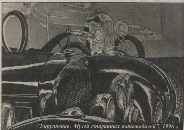
"Укрупнение. Музей старинных автомобилей", 1996 г.