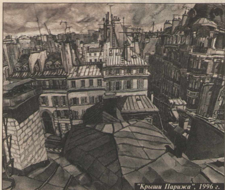
"Крыши Парижа", 1996 г.