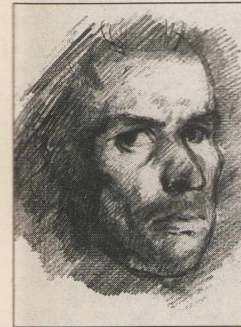
Слева: Н. Ромадин. "Свежий ветер". 1954 г. Справа: "Автопортрет". 1948 г.

Картина "Керженец", написанная в 1946 году, стала эталонной в творчестве художника. Самой характерной для него, самой романтической и таинственной. Ее сюжет, на первый взгляд, очень прост. Пора весеннего половодья, густой лес, словно вырастающий из темной, мрачной воды и застывший в каком-то томительном ожидании. И даже утлая лодочка с двумя человеческими силуэтами не тревожит это волшебное, "берендеevo"