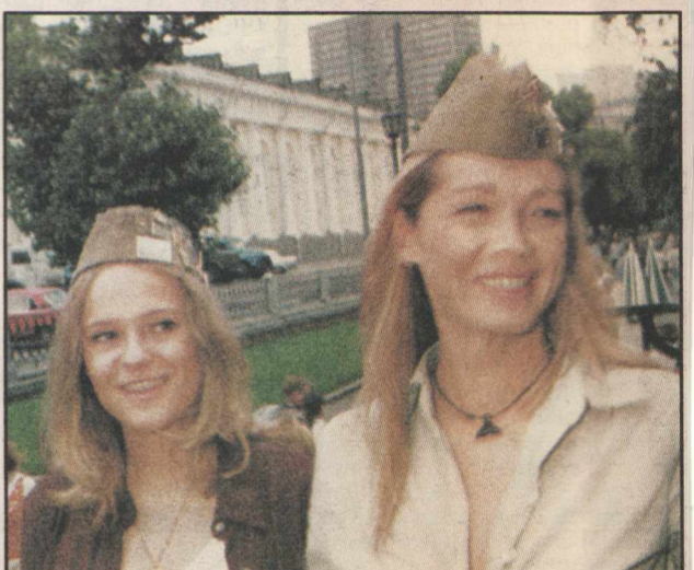
В любых вы, душеньки, нарядах хороши...