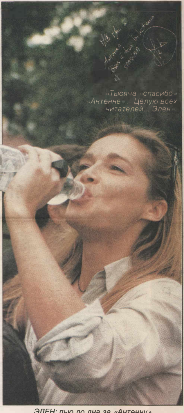
ЭЛЕН: пью до дна за «Антенну»