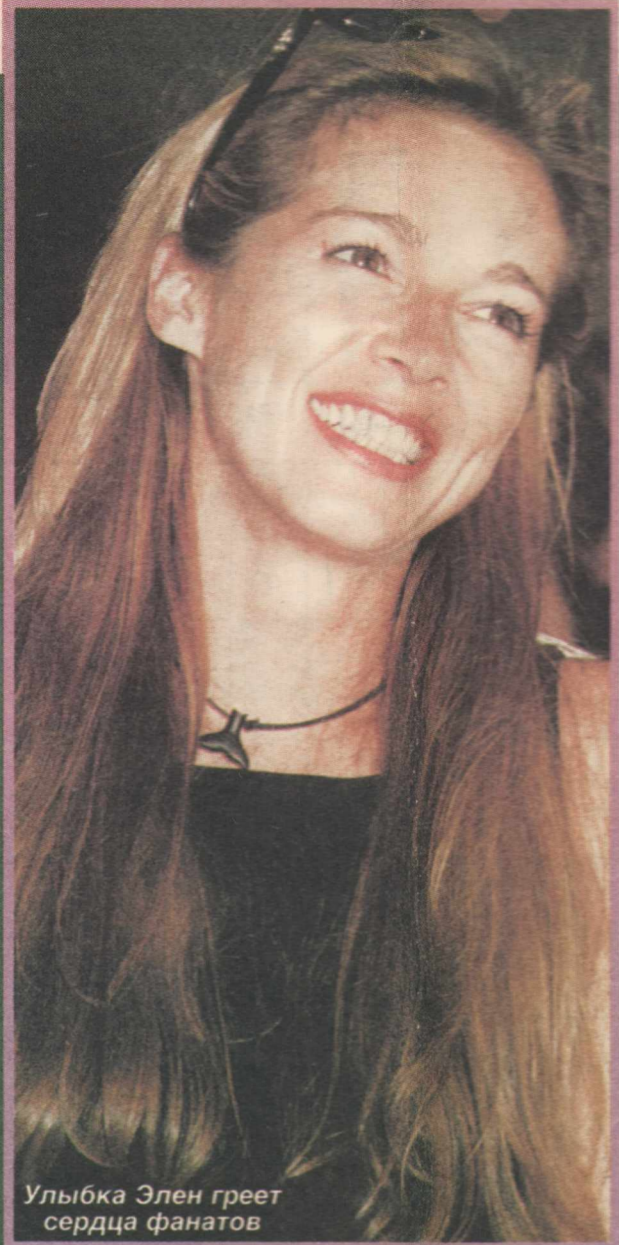
Улыбка Элен греет сердца фанатов

Пройдет какое-то время, и события этих дней будут восприниматься мною, как прекрасный сон, отозвучавший в душе сладким эхом. А ведь все это было, было... Приземлился стремительный лайнер в «Шереметьево-2», распахнулись дверцы шикарного белого «линколна», и я оказалась на одном сиденье между двух девочек, о которых грезят миллионы фанатов на всех континентах мира. Удивительно, но именно с любви к Элен Ролле началось мое сотрудничество с газетой «Антенна». В течение нескольких лет, пока сериал «Элен и ребята» кочевал по телеэкранам планеты, я разыскивала в зарубежных журналах, перечитывала и пересказывала нашим читателям всевозможные подробности про Элен и ее друзей. И все же о многом скрытная Элен никогда не рассказывала журналистам. А в эти сорок минут, пока машина мчалась из аэропорта в Лужники, она вдумчиво разоткровенничалась. Не потому ли, что почувствовала мой откровенно неформальный интерес к ее судьбе? Какое счастье, что я в совершенстве владею именно французским!