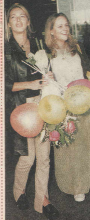
Обратите внимание, какой прикид диктует нынче парижская мода

Интервью с актрисой Камилей Реймон читайте в ближайших выпусках «Антенны».