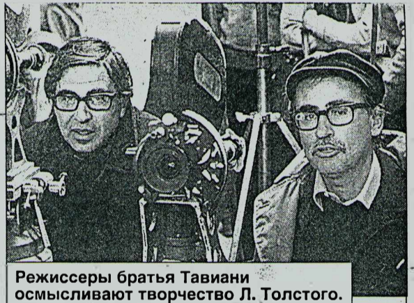
Режиссеры братья Тавиани осмысливают творчество Л. Толстого.