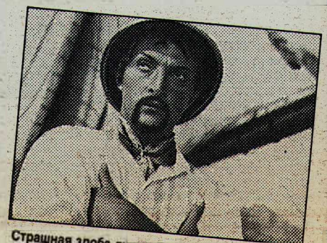
Страшная злоба душит Зуриту. Он узнал, что его невеста Гуттиэре любит Иктиандра.

Вспоминает Эдуард Розовский: «Был один эпизод, очень интересный, но сложность которого никто не заметил — когда Иктиандра привязывают к якорю и сбрасывают в воду. Представьте: могучий чугунный якорь метра два в высоту — как переживет это актер? Я с самого начала решил испытать все на себе. Прицепились к якорю вдвоем с мастером спорта, не привязываясь, и нас сбросили. Я даже не успел понять, что произошло, потому что с грохотом, с пузырями, с шумом нас выбросило на поверхность, полуголушенных и полуслепых. После такого эксперимента было решено сбрасывать муляж».