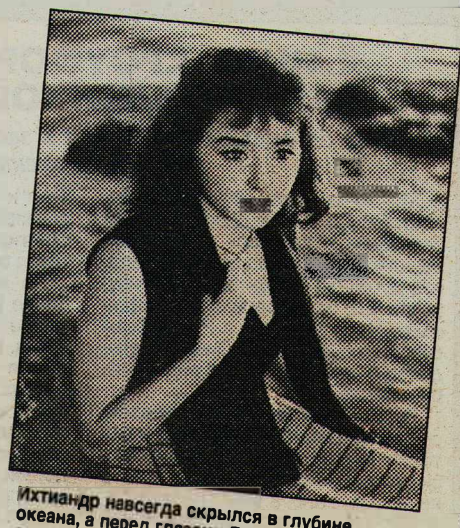
Иктиандр навсегда скрылся в глубине океана, а перед глазами Гуттиэре все стоит его прекрасный образ.