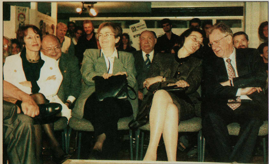
Первый ряд московской интеллигенции

Подготовил Игорь ШЕВЕЛЕВ