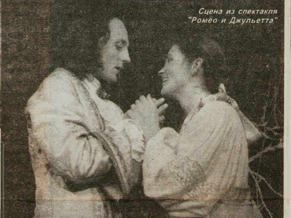
Сцена из спектакля "Ромео и Джульетта"