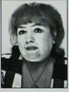
Беседовала Евгения Ульченко

Журналист, педагог, писатель, сценарист, драматург и режиссер, народный артист России Марк Розовский многим успел позаниматься в жизни, прежде чем в 1983 году организовал театр «У Никитских ворот» — один из самых камерных и элитарных столичных театров. Сегодня он беседует с нашим корреспондентом о книгах, театре и вообще обо всем на свете.