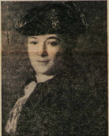
Портрет неизвестного в треуголке.

знающей пощадой насмешкой и чувственным самодовольством человека, любящего пожить властью. Фон портрета светлый, теряющий обычную для Рокотова таинственность, — многоцветен, как жизнь, на которую Майков взирал с видимым удовольствием. Он даже лоснится от этого удовольствия, чуть ли не прищмокивает, как бы снисходительно вещая: «Любите жизнь во всех ее проявлениях, как люблю ее я...» Есть в этом призыве что-то плутовское, чуточку обольщающее.