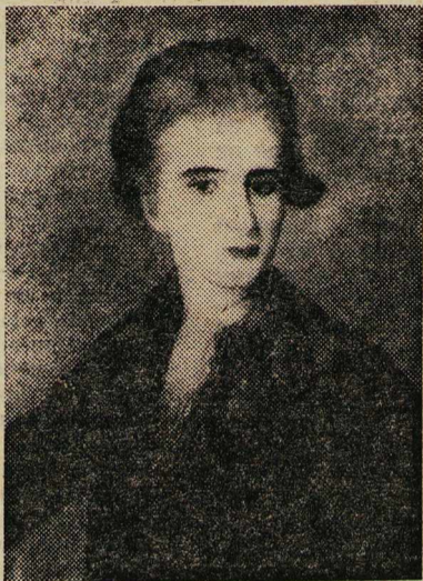
Ф. РОКОТОВ. Портрет Н. Е. Струйской.

Но сам Майков малым не довольствовался, жадно, хоть и неудачливо стремился к жизненному успеху... Противоречивая двойственность характера отражена в портрете, который часто называют самым «земным» в творчестве Рокотова. Умная зоркость соединена здесь с не-