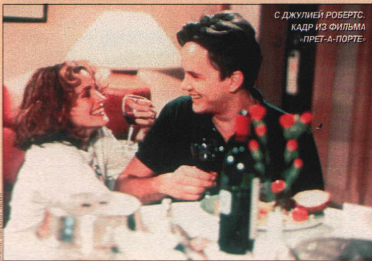
С ДЖУЛИЕЙ РОБЕРТС. КАДР ИЗ ФИЛЬМА «ПРЕТ-А-ПОРТЕ»