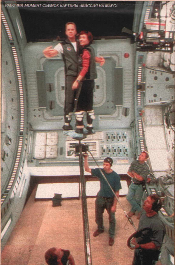
РАБОЧИЙ МОМЕНТ СЪЕМОК КАРТИНЫ «МИССИЯ НА МАРС»

Когда театр разорился, Тим с облегчением вздохнул. И достаточно быстро согласился сниматься в боевике «Лучший стрелок», прославляющем амери-