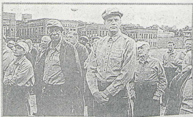
В фильме «Побег из Шоушенка» герою Роббинса (в центре) пришлось много копать.

- Ну что, Сюзан, сорвем сегодня «оскарговскую» церемонию?