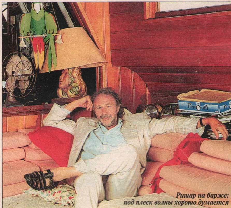
Ришар на барже: под плеск волны хорошо думается

Пьеру Ришару пошел уже седьмой десяток. Он мог бы, наверное, как и Жан-Поль Бельмондо, сказать, что не хочет закончить карьеру гримасничающим старым «га-га». Поэтому стал очень разборчив. Снова вернулся в театр, где не так давно сыграл в двух небольших пьесах знаменитого комедиографа Жоржа Фейдо.