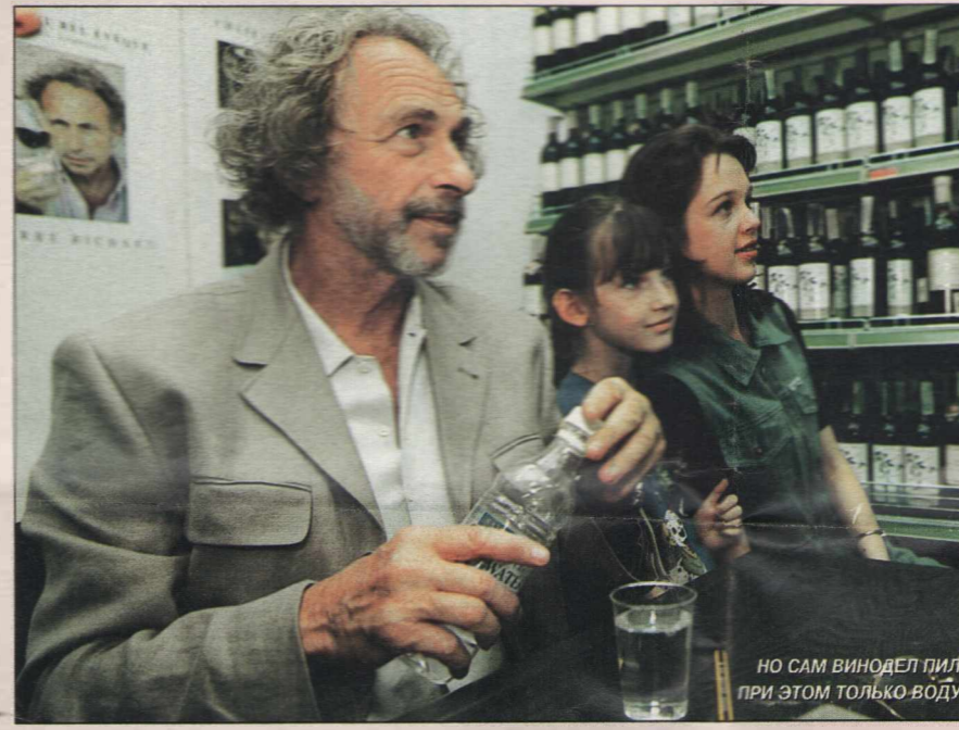
НО САМ ВИНОДЕЛ ПИЛ ПРИ ЭТОМ ТОЛЬКО ВОДУ

Надо сказать, что сходство шофера и великого актера действительно редкостное. Настоящий Ришар, когда увидел