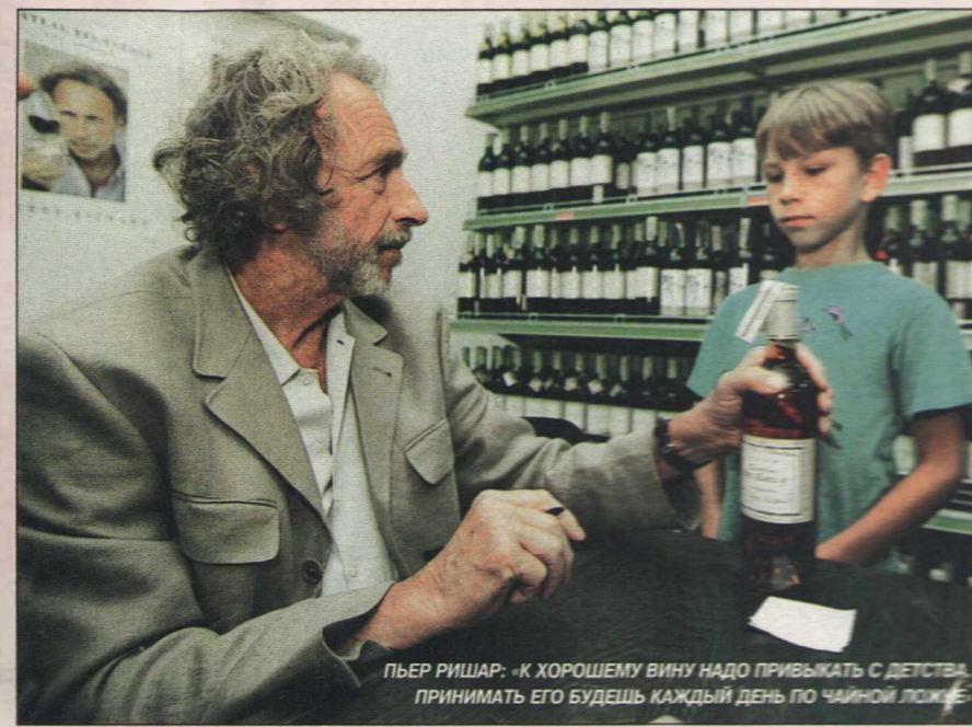
ПЬЕР РИШАР: «К ХОРОШЕМУ ВИНУ НАДО ПРИВЫКАТЬ С ДЕТСТВА. ПРИНИМАТЬ ЕГО БУДЕШЬ КАЖДЫЙ ДЕНЬ ПО ЧАЙНОЙ ЛОЖКЕ»

встречали его в кемеровском аэропорту хлебами, разносолами и немалой чарой водки. Водка была превосходная, тройной очистки, но почему-то теплая. «О ля-ля!» — только и смог сказать француз... В Москве эту встречу актер вспоминал уже с юмором: «Первый раз в жизни пришлось пить водку в семь утра, в таком количестве, да еще теплой! И это в холодной Сибири!» Между тем причина визита Ришара в столицу