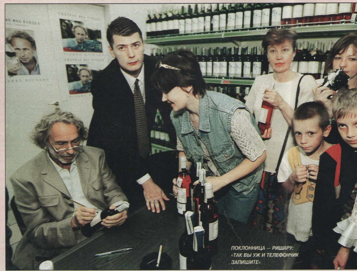
ПОКЛОННИЦА — РИШАРУ: «ТАК ВЫ УЖ И ТЕЛЕФОНЧИК ЗАЛИШИТЕ»