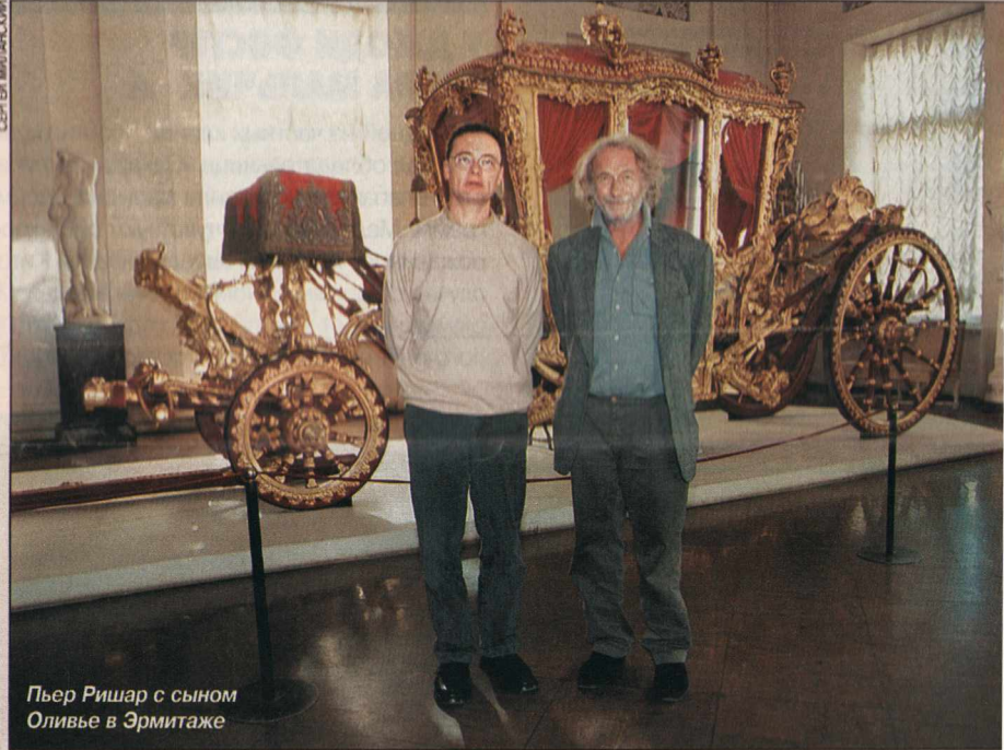
Пьер Ришар с сыном Оливье в Эрмитаже