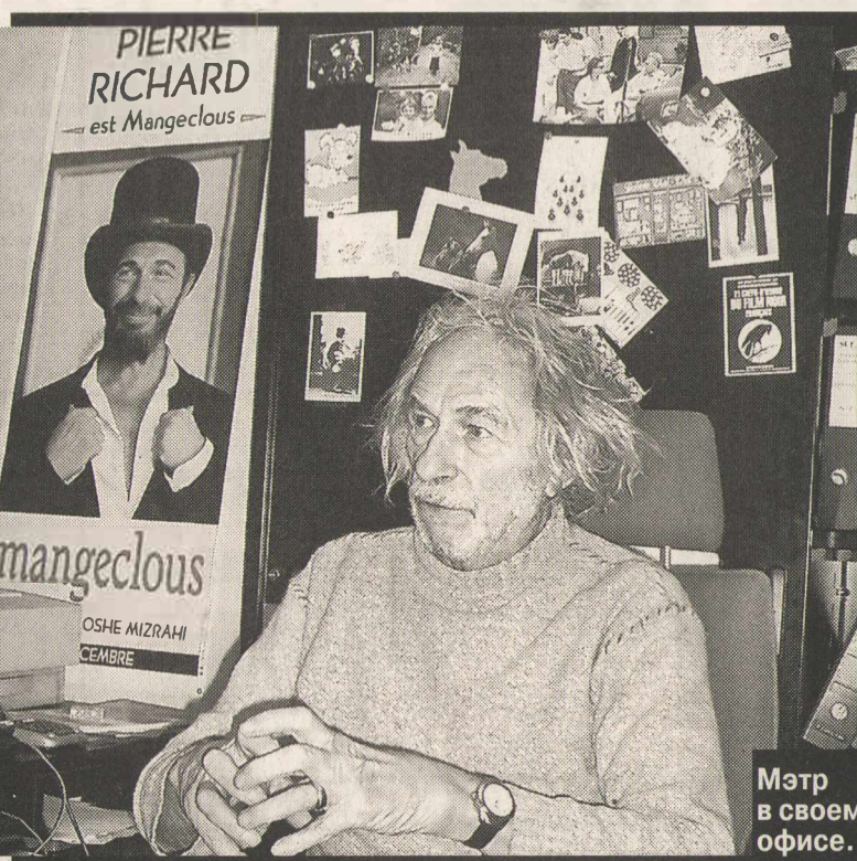
Мэтр в своем офисе.

— Я слышала, что вы в больших друзьях с Жераром Депардьё.