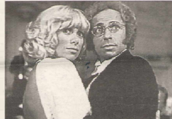
«Возвращение высокого блондина».