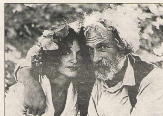
«Тысяча и один рецепт влюбленного кулинара».