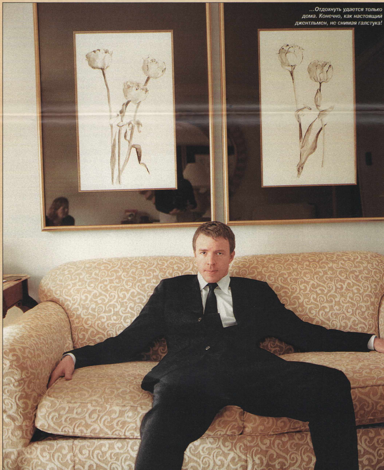
...Отдохнуть удается только дома. Конечно, как настоящий джентльмен, не снимая галстука!

ла себя плохо, роды начались раньше времени. Гай до того расписывался, что ни за что не захотел доверить кому-либо из шоферов везти Мадонну в госпиталь. А потом он бежал по коридору госпиталя за каталкой и страшно матерился на врачей (ему казалось, что они слишком неторопливы) — Мадонна успокаивала его: «Мальш, все будет хорошо!»