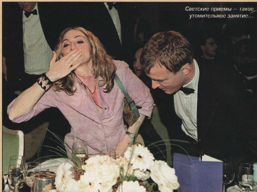
Светские приемы — такое утомительное занятие...

...Черный «Мерседес» на огромной скорости несся по ночному Нью-Йорку. На заднем сиденье стонала женщина, за рулем сидел сосредоточенный мужчина: главное — успеть! За три недели до положенного срока Мадонна почувствова-