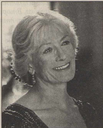
Сверху: Ванесса Редгрейв в фильме "Миссис Дэллоуэй". Справа: Наташа Ричардсон в спектакле "Кабаре"

Может быть, поэтому на другой стене в ее гримбурной висит репродукция картины Мюнха "Вопль".