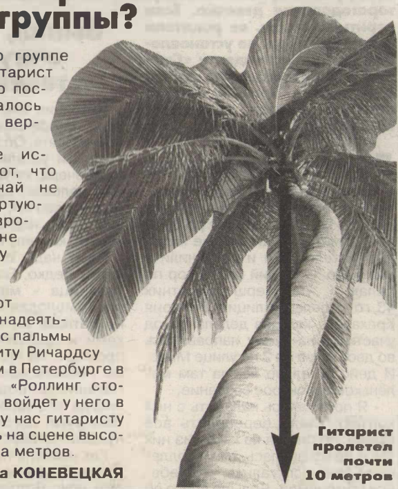
Гитарист пролетел почти 10 метров