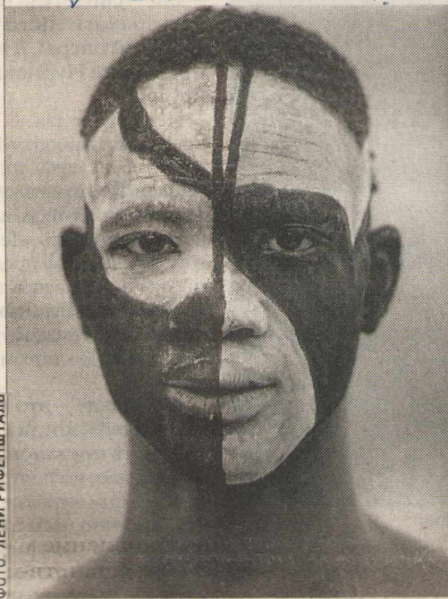
ФОТО: ЛЕНИ РИФЕНШТАЛЬ

В галерее «Дом Нашокина» работает выставка Лены Рифеншталъ. На ней представлено несколько десятков потрясающей красоты фотографий (точнее — принтов) из африканского цикла.