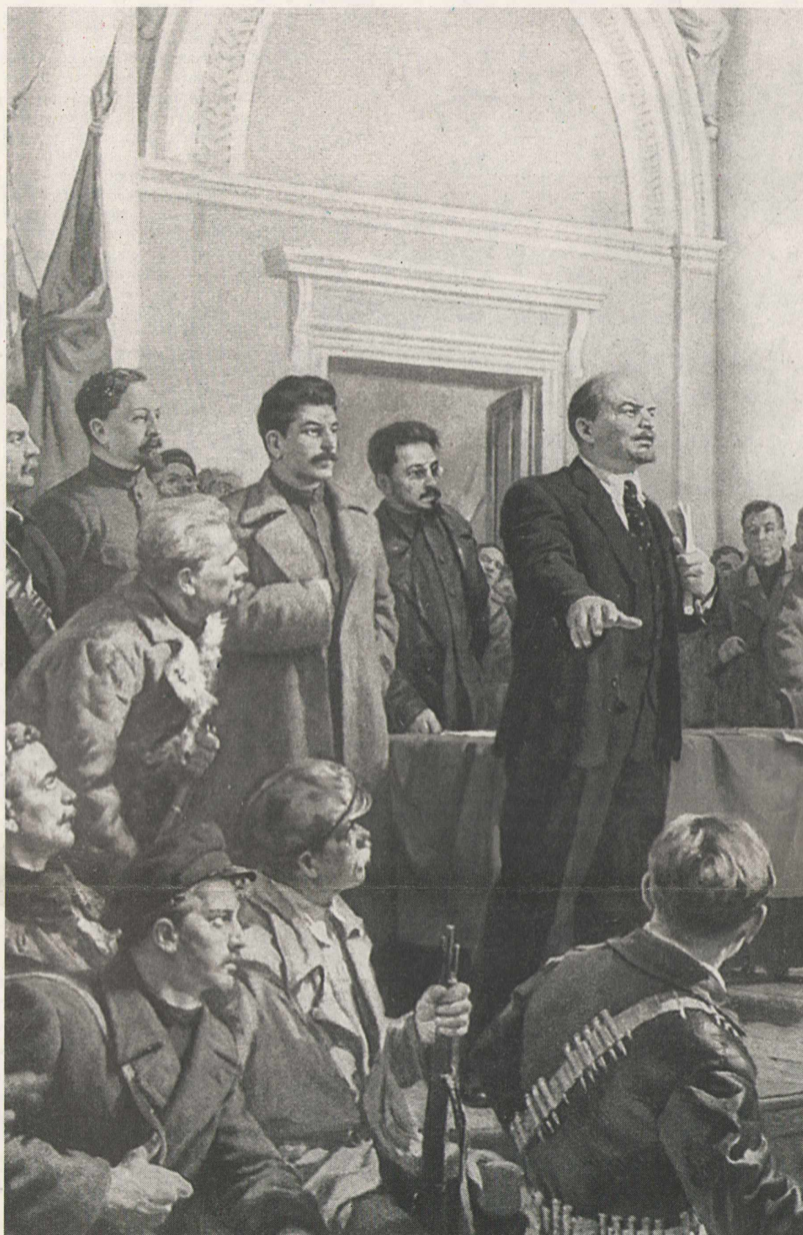
Возможности эстетизации зла почти безграничны.

О том, как при Гитлере выполнялось указание Ленина насчет «важнейшего из всех искусств»