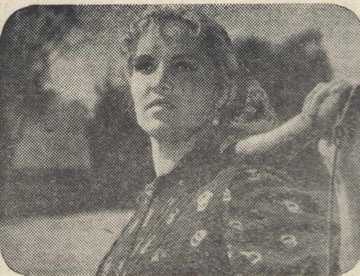
Кадр из фильма «Счастье надо беречь»