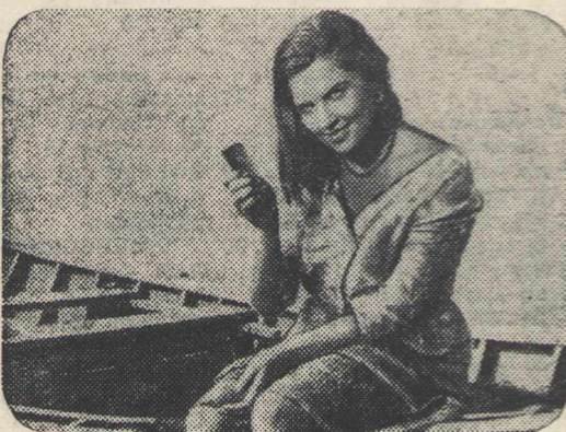
Кадр из фильма «Мальва»

бергс стала роль Аии в латышском фильме «Эхо» (режиссер В. Круминьш). Сценарий фильма написан по мотивам произведений латышского писателя Я. Яунсудрабиня. В центре