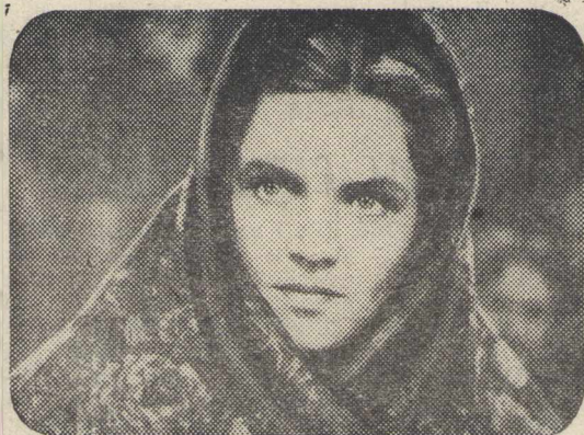
Кадр из фильма «Гроза над полями»