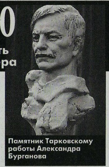
Памятник Тарковскому работы Александра Бурганова

Сегодня у разрушенного дома в 1-м Шилковском переулке, где прошло детство режиссера, отслужили молебен. В музее «Дом Бурганова» открыт памятник-бюст Андрея Арсеньевича. Сегодня же состоится торжественные вечера в «Новой Опере» и музее «Дом Цветаевой». В доме кино проходит ретроспектива фильмов режиссера, в которую включены отреставрированные уникальные киноленты из архивов Госфильмофонда. А в фойе Дома кино открыта фотовыставка «Мой Тарковский». Большая экспозиция фотографий «Андрей Тарковский» планируется в июне в Манеже. В храме Христа Спасителя хотят провести концерт Большого симфонического оркестра под управлением Клаудю Аббадо. Фестиваль «Вспоминания Тарковского» должен состояться в Петербурге. Осенью дни его памяти пройдут в рамках Дней российской культуры во Франции и Италии. На ок-