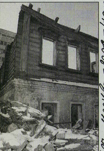
Руины вместо музея. Пока

Сегодня исполняется 70 лет со дня рождения кинорежиссера Андрея Тарковского, автора знаменитых лент в отечественном кинематографе — «Андрея Рублева», «Сталкера», «Зеркала», «Ностальгии».