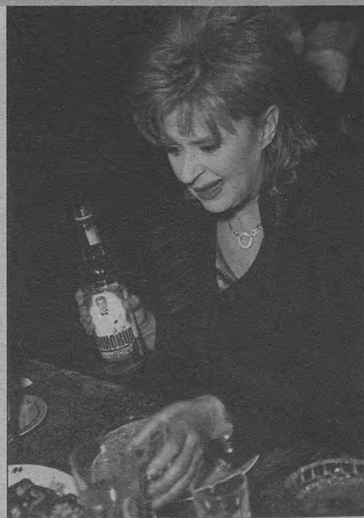
«Винокур» — «За благополучие «Аншлага»!

Регина счастлива, что ее пенцы становятся популярными артистами. Она настоящий профессионал: более внимательных людей в том, что касается работы, я не видел. Сейчас у «Аншлага» тяжелые времена, мы ищем новую форму, и Регина себя покажет — у программы, оказавшейся в условиях острой конкуренции, будет новый всплеск.