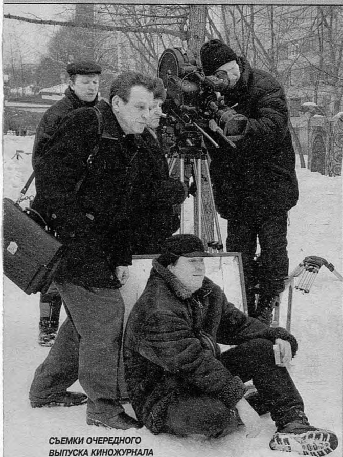
СЪЕМКИ ОЧЕРЕДНОГО ВЫПУСКА КИНОЖУРНАЛА