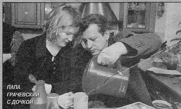
ПАПА ГРАЧЕВСКИЙ С ДОЧКОЙ

ползать на коленках, и держать над камерой то жвачку, то шоколадку: «Сыграешь — твоя!» — «Правда моя?» — «Правда-правда!» Вот и идет малыш за камерой, словно ослик за морковкой.