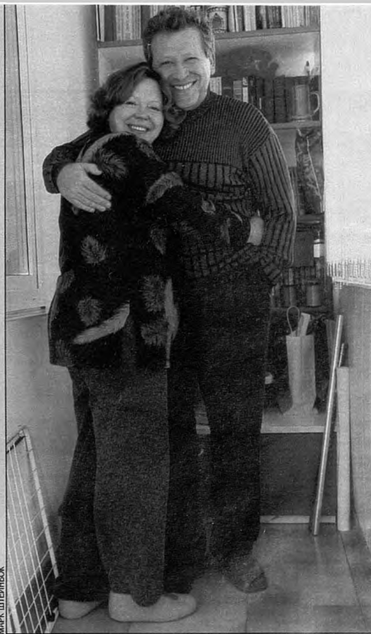
...супруги Грачевские сегодня

— Нет, у этой истории недостаточно яркий финал. В моем детстве бывали эпизоды и посмешнее. Вот, к примеру, один случай из моей школьной жизни, который впоследствии стал сюжетом к «Ералашу». Мы с друзьями очень любили разыгрывать людей на нашей пригородной станции. Становились в тамбуре перед открытыми дверями электрички и начинали что есть мочи шипеть. Слыша характерные звуки отъезжающего поезда, пассажиры с большими тюками и авоськами начинали сломая голову нести по перрону и запрыгивать в вагоны. А мы, наблюдая эту суматоху, давились от смеха! Но однажды нарвались на пожилого дядьку с более острым чувством юмора, нежели у нас. Поняв, что его мастерски разыграли два желторотых юнца, он и говорит: «Молодцы, здорово придумали! А чего вы в тамбуре-то пшикаете? На улице будет лучше слышно». Мы вышли на перрон и разом крикнули: «Три-четыре, пш-ш-ш...» В этот момент двери поезда и закрылись! А мы остались на платформе.