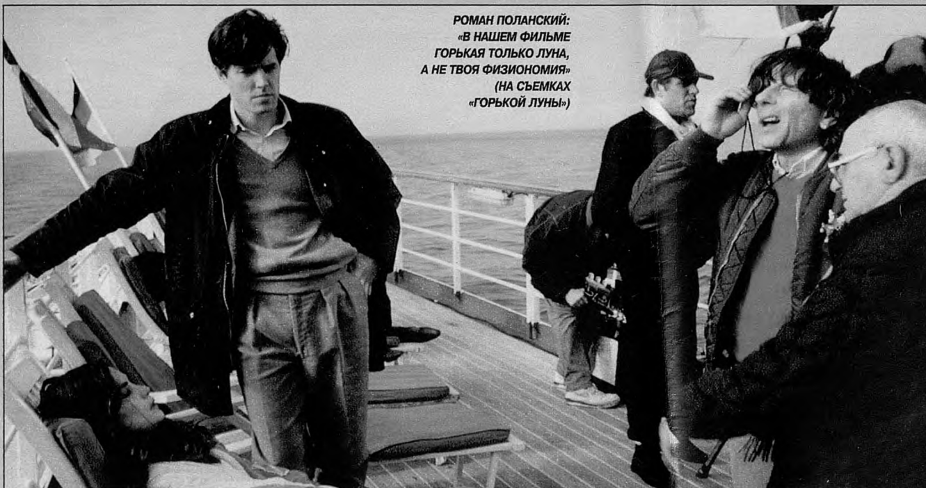
РОМАН ПОЛАНСКИЙ: «В НАШЕМ ФИЛЬМЕ ГОРЬКАЯ ТОЛЬКО ЛУНА, А НЕ ТВОЯ ФИЗИОНОМИЯ» (НА СЪЕМКАХ «ГОРЬКОЙ ЛУНЫ»)