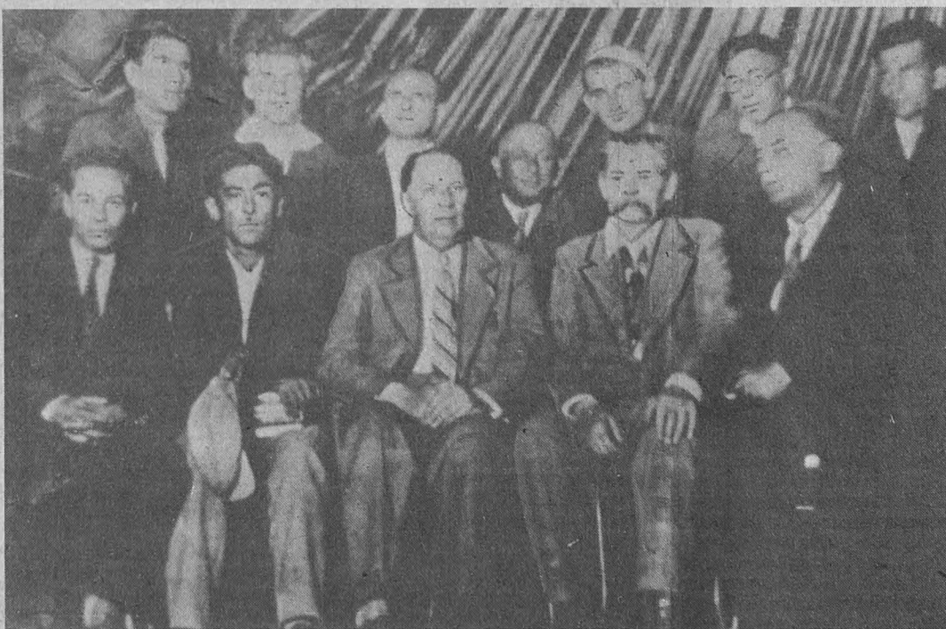
1934 год. Первый Всесоюзный съезд писателей в Москве. М. ГОРЬКИЙ и А. ТОЛСТОЙ среди азербайджанских писателей.