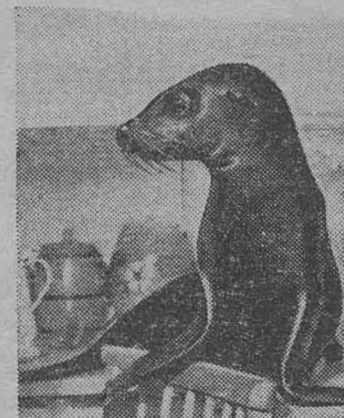
На снимках (сверху вниз):