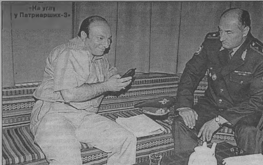
«На углу у Патриарших-3»