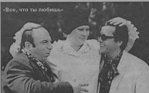
«Все, что ты любишь»