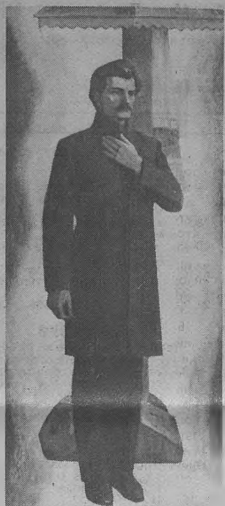
И. РЕЙ. «Путь поэта».

...По глумим лесам бродит седой лесун. Он дик и печален, как доля селянина. И эту